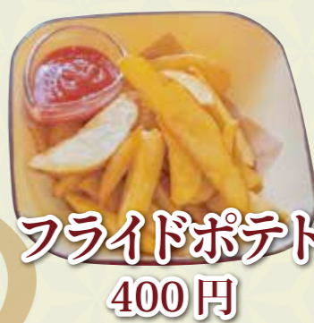
フライドポテト 400 円