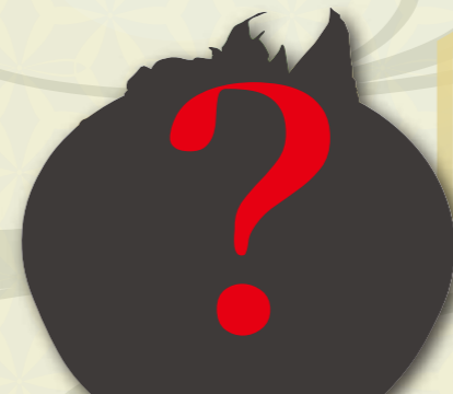
うに・いくら井 (時価) 3,000~5,000 円