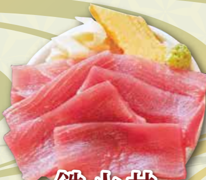
鉄火井 1,500 円