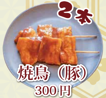
焼鳥 (豚) 300 円