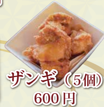
ザンギ (5個) 600 円