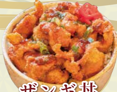
ザンギ井 700 円