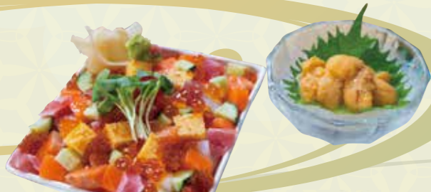
海鮮チラシ井 1,500 円