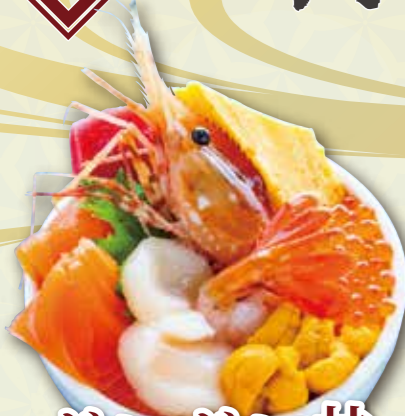
ガンガン井 2,200 円

※価格は税込みです。 ※全品お持ち帰り可。 ※お持ち帰りの際にはお早めにお召し上がりください。