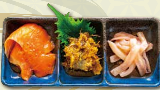
3点盛り 1,000 円