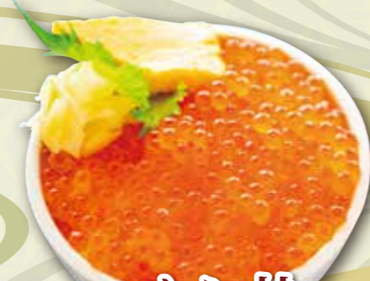
いくら井 3,000 円