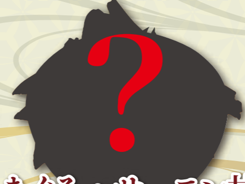
まぐろ・サーモン井 1,600 円