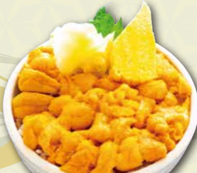
うに井 (時価) 4,000~6,000 円