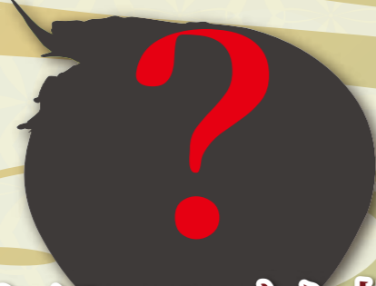
かに・いくら井 2,000 円