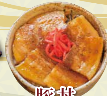
豚井 800 円