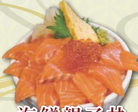
海鮮親子井 1,800 円