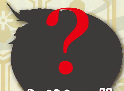
ネギトロ井 1,000 円